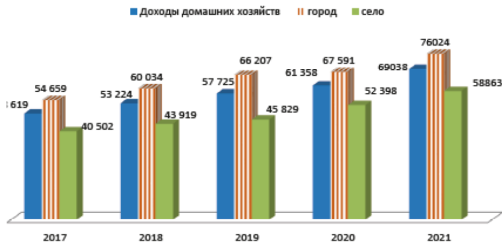
Рисунок 2 - Доходы домашних хозяйств в среднем на душу населения, тенге

Примечание – Составлено авторами по источнику Bureau of National Statistics (2022)