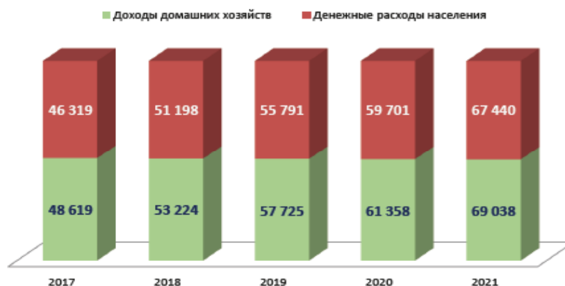
Рисунок 4 - Соотношение доходов и расходов населения в Казахстане,% Figure 4 - The ratio of income and expenditure of the population in Kazakhstan,%

Примечание – Составлена на основании данных таблицы 2