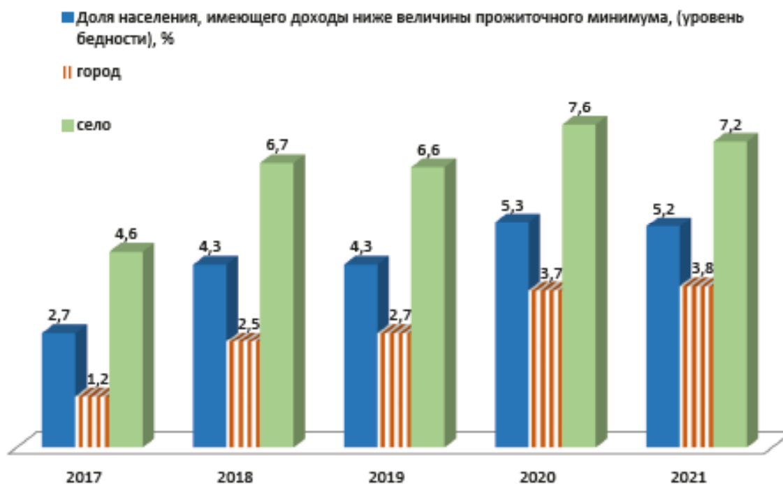
Рисунок 3 - Уровень бедности в Казахстане за 2017-2021 гг., %

На основании таблицы 2 сформирован рисунок 3, на котором наглядно отражена динамика изменения уровня бедности в Казахстане за 2017-2021 годы.