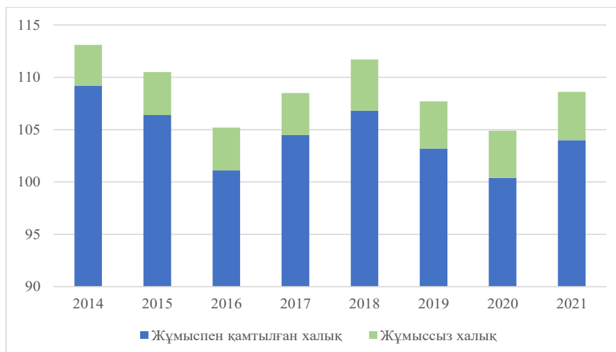
Сурет 1 - Ұлытау облысының еңбек нарығының көрсеткіштері, мың адам.

Ресми статистика мәліметтері жұмыспен қамтылған халық санының азаю үрдісі мен жұмыссыздықтың өсуі туралы куәландырады (1-сурет).