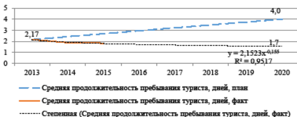
Рисунок 3 – Сравнительный анализ прогнозных значений среднего пребывания туриста в Казахстане

было организовано участие Казахстана в ряде международных туристских выставок: ITB (г. Берлин), «Интурмаркет» (г. Москва), АТМ (г. Дубай), ITE (г. Гонконг), РАТА Travel Mart-2015 (г. Бангалор), JATA-2015 (г. Токио), WTM (г. Лондон).