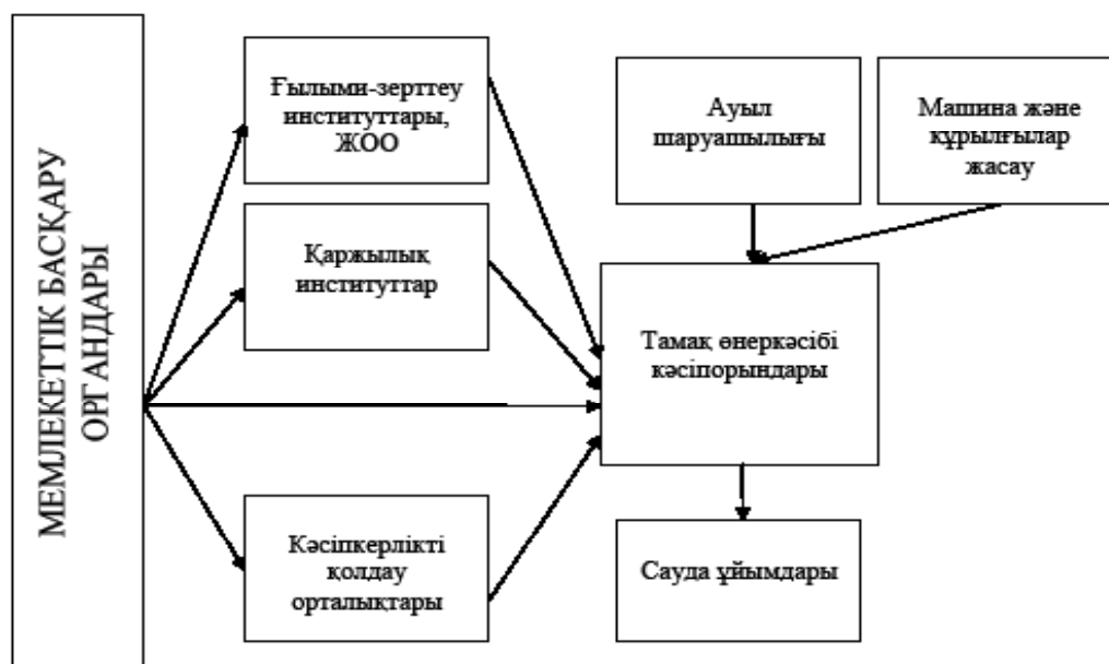
Сурет 2 – Тамақ өнеркәсібіндегі инновациялық үдеріс қатысушыларының өзара байланысы Тамақ өнеркәсібінде инновациялық қызметті дамыту жүйесін құруда мемлекет – инновациялық

белсенді бағыттарды айқын-дау, жүзеге асырылатын жобаларды және оларға ғылыми және білім беру мекемелерінің қатысу мүмкіндігін анықтау, инновациялық үдеріске қатысушы кәсіпорындарды анықтау, жүзеге асырылатын инновациялардың өзара байланысы мен олардың салалық тиімділігіне тигізер әсерін анықтау сияқты да маңызды міндеттерді атқарады.