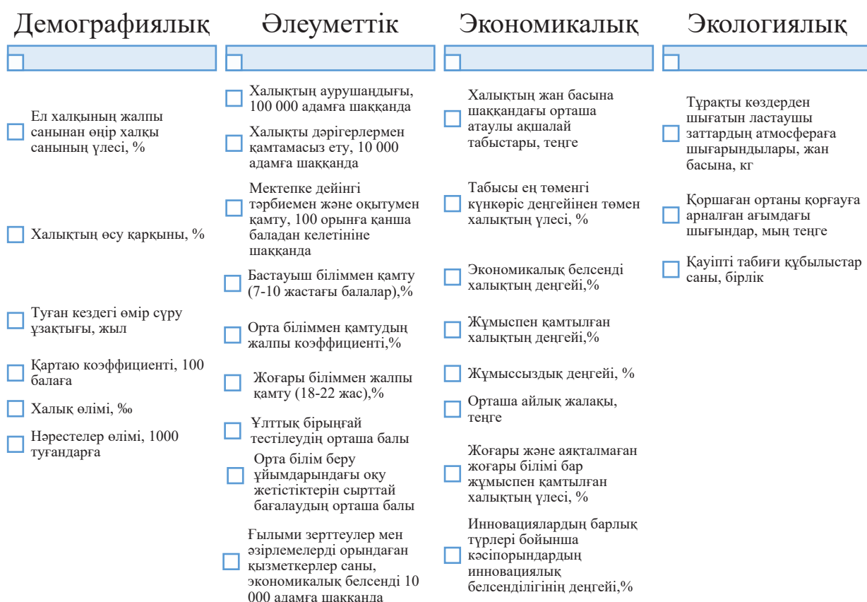
1-сурет - Қазақстан Республикасы өңірлерінің адами капиталының жай-күйін бағалау индикаторларының құрылымы

Бұл зерттеу аймақтың адами капиталын кешенді бағалау әдістемесін ұсынады. Факторлық талдау негізінде адами капиталдың интегралды құрамдас бөліктеріне топтастырылған адами капиталдың негізгі көрсеткіштері таңдалды: демографиялық, әлеуметтік, экономикалық және экологиялық (1-сурет). Республикалық адами капиталдың интегралдық индексі есептеу кезінде авторлар сандық талдау үшін ғана емес, сапалық үшін де индикаторларды таңдады.