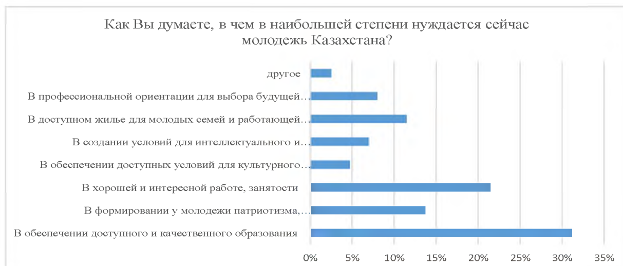
Рисунок 8 - Определение потребностей молодежи после окончания бакалавриата Figure 8 - Determining the needs of young people after graduation from bachelor's degree

Как видно из рисунка 8, потребность молодежи в обеспечении доступного и качественного образования выбрали треть выпускников университетов - 31% (и 36% - выпускники школ, лицеев и колледжей); потребность в хорошей и интересной работе, занятости выбрали 21% респондентов; патриотизм, нравственное и духовное развитие молодежи отметили 14% (так же отметили выпускники школ); 11% выпускников отметили потребность в доступном жилье для молодых семей и работающей молодежи. В целом, сравнивая результаты анкетирования выпускников школ, колледжей и вузов, мы видим, что выбор ответов по указанным вопросам сильно не отличается.