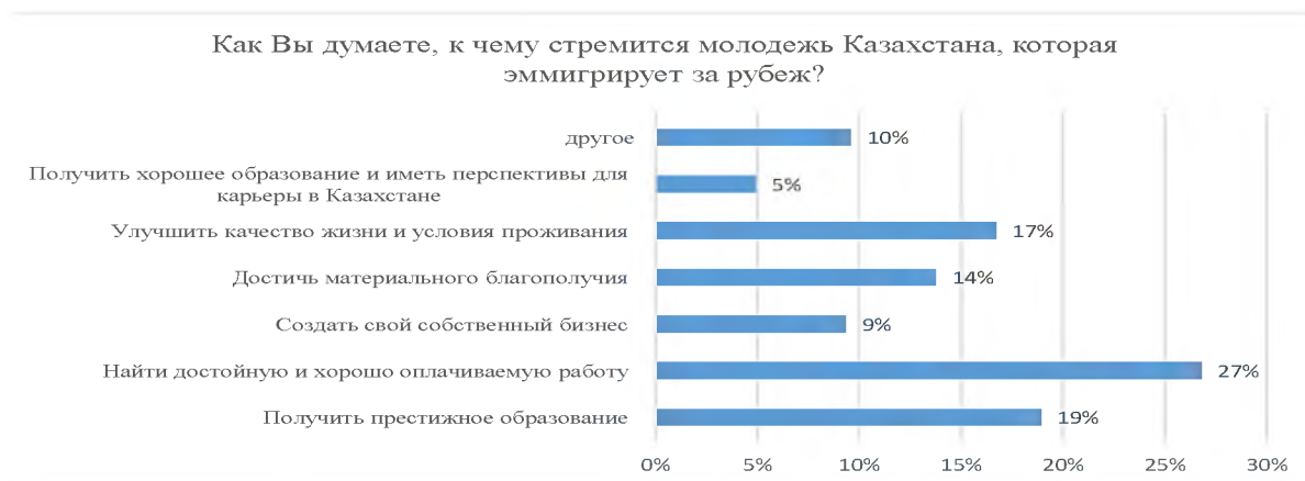
Рисунок 4 - Возможности достижения интересов в эмиграции

ной работе и 9% в профессиональной ориентации выбора будущей профессии. Качественное образование сегодня - путь к успеху и главный инструмент развития экономики. Мы считаем, что стремление молодежи к качественному образованию является одним из важных позитивных факторов развития страны.