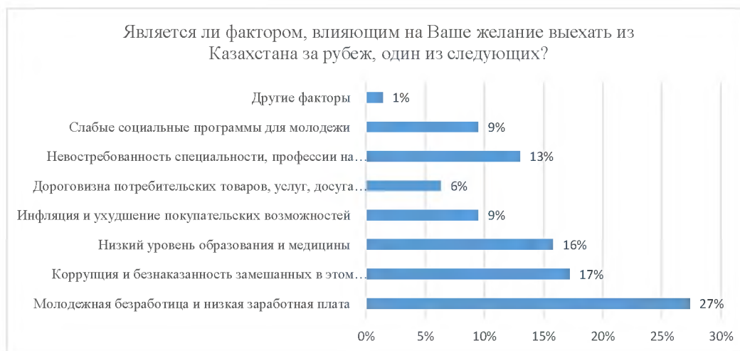
Рисунок 6 - Определение выталкивающих факторов миграции молодежи за рубеж

Далее, определяя какие факторы влияют на желание молодежи выехать из страны, исследователи выявили, что в большей степени наша молодежь озабочена безработицей и низкой заработной платой – 27%; коррупцией и безнаказанностью должностных лиц – 17%; отсталостью в развитии уровня образования и медицины - 16%; инфляцией и ухудшением покупательских возможностей – 10%; дороговизной потребительских товаров, услуг, досуга и пр. – 6%; невостребованностью специальностей бакалавриата на рынке труда – 13%; а также слабыми социальными программами для молодежи – 10% (рисунок 6).