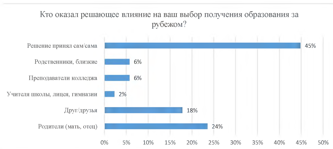
Рисунок 7 - Влияние на выбор получения зарубежного образования Figure 7 - Influence on the choice of obtaining a foreign education

Примечание - Разработано авторами по результатам социологического опроса