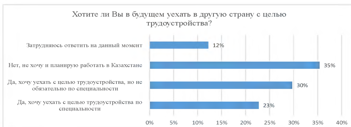
Рисунок 5 - Результат по опросу желания работать за рубежом выпускников школ

что за рубежом создадут собственный бизнес и достигнут материального благополучия. Следующий вопрос затрагивает желания респондентов работать в другой стране (рис.5), и очень важно отметить, что только 24% молодых людей отметили желание остаться работать в Казахстане, а 67% – трудоустроиться в зарубежных странах.