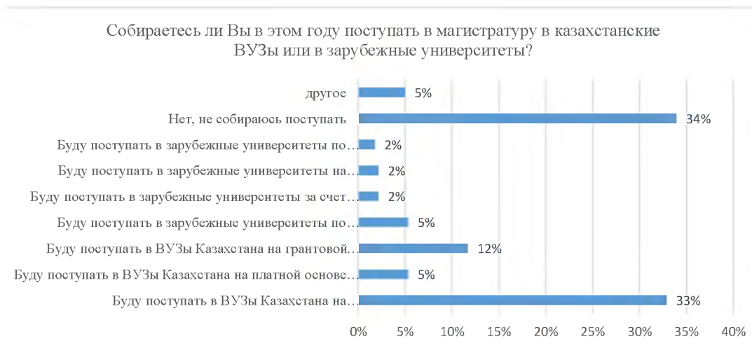
Рисунок 1 - Результаты анкетирования о дальнейшем образовании Figure 1 - Results of the questionnaire on further education