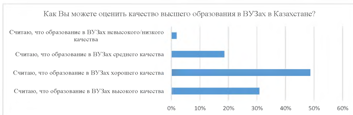
Рисунок 2 - Оценка респондентов о качестве образования в вузах Figure 2 - Respondents' assessment of the quality of education in universities

Примечание - Разработано авторами по результатам социологического опроса