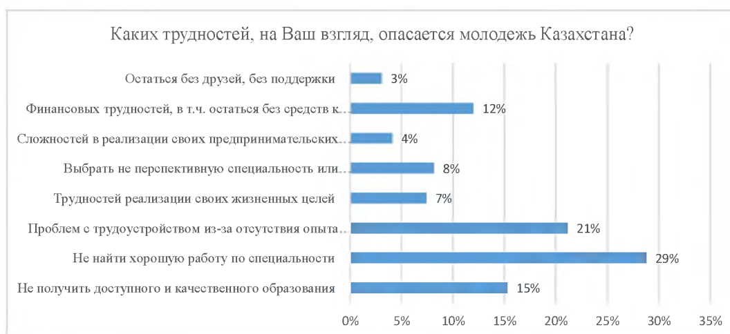
Рисунок 10 - Определение трудностей, которых опасается молодежь Казахстана