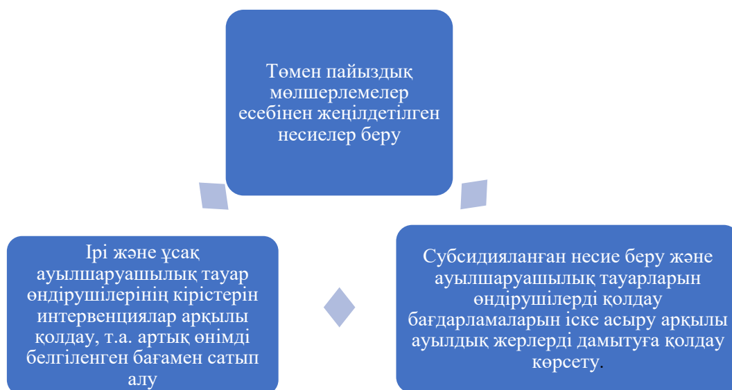
Сурет 3 - Бразилияның ауылшаруашылық өндірісіндегі ішкі қолдауды үш бағытқа бөліп қарастырады Figure 3 - Internal support in Brazilian agricultural production is divided into three areas

Ескерту: әдебиет негізінде автормен құрастырылған (Yarkova, 2019)